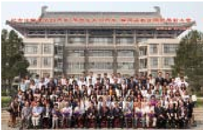
中国韩国（朝鲜）语教育研究会成立 10 周年

70-80%。但地方院校一般只有20-30%。而在一些学校，在职教师要走出去读学位的话，等再回来自己的岗位可能就没有了，所以很矛盾。这也是制约韩国语教育发展的一个瓶颈问题。这个问题的解决直接影响到今后老师的学历、学位、职称、晋升等问题。伴随这个问题，引申出一个更大的制约因素，那就是目前韩国语教学研究没有全国性的核心刊物。像英语、俄语、日语都有自己的核心刊物，但是韩国语没有，韩国语的研究论文写得再好，没有核心刊物就无法发表，影响职称晋升，这是影响年轻教师积极性的一大方面。像北大、复旦、上外等一些大学规定，只要在韩国的正规论文集上发表的，或是在韩国核心刊物上发表的论文都可以作为核心刊物水平来鉴定。还有的学校是把延边出版的“中国朝鲜语文”杂志视为核心刊物，但是认同这些的学校很少，所以现在迫切需要有一个全国性的核心刊物。